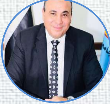
نائب رئيس الجامعة