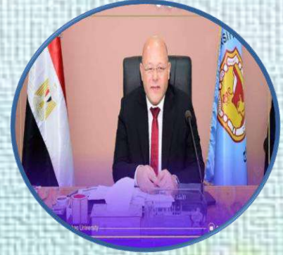
رئيس جامعة سوهاج